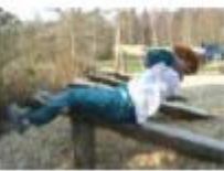
ØVELSE NR. 7 BENLØFT