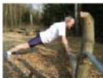
ØVELSE NR. 1 ARMBØJNINGER