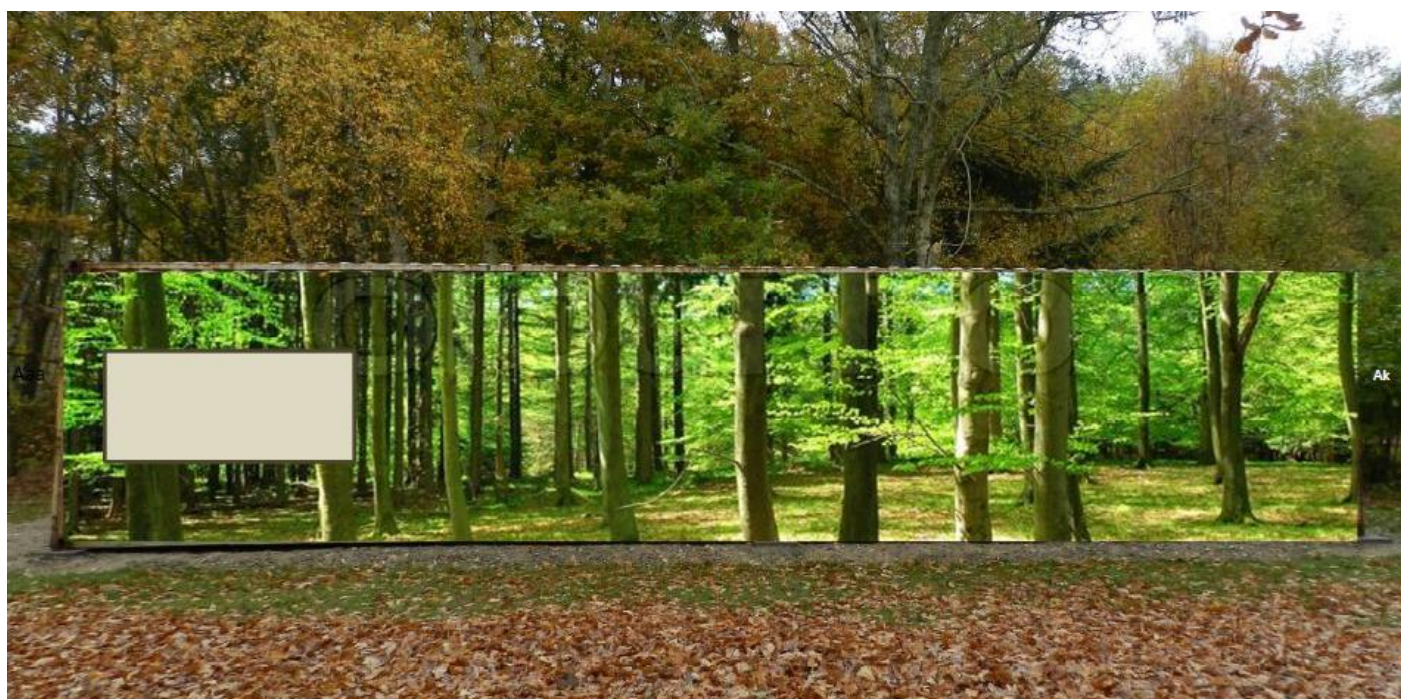
Eller dekorering med et forsommer skovmotiv ?

Hyggelige hilsner - og på gensyn til julegåturen PÅ bestyrelsens vegne