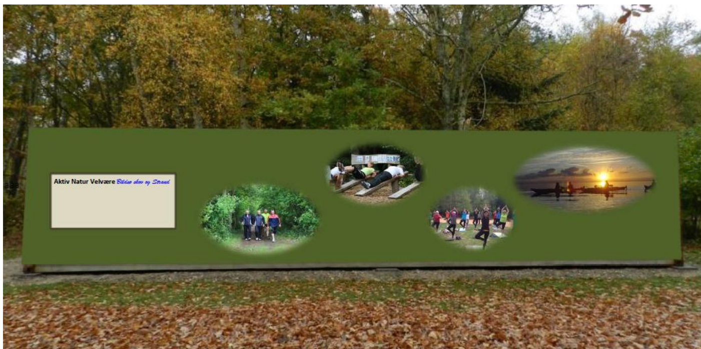
Dekorering med forskellige motiver fra vores aktiviteter?